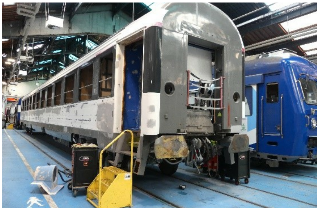
SNCF Voyageurs / Direction du Matériel

vrait acheminer une nouvelle tranche Paris - Berlin. Ce lancement devrait se faire simultanément avec celui d'un Bruxelles - Vienne/Berlin. Les trains en provenance de Paris et de Bruxelles échangeront leurs voitures à Mannheim.